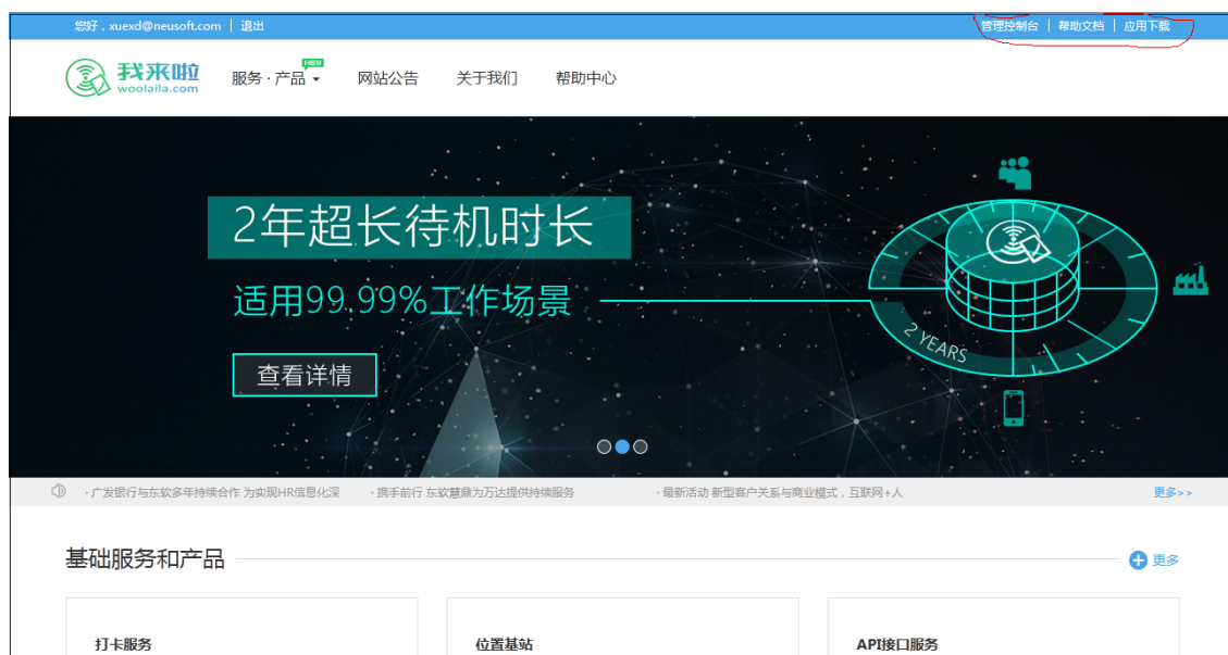
图 1 我来啦企业管理后台

进入我来啦系统企业管理后台，输入企业管理员的账号、密码和验证码，即可登录到我来啦系统企业管理后台：