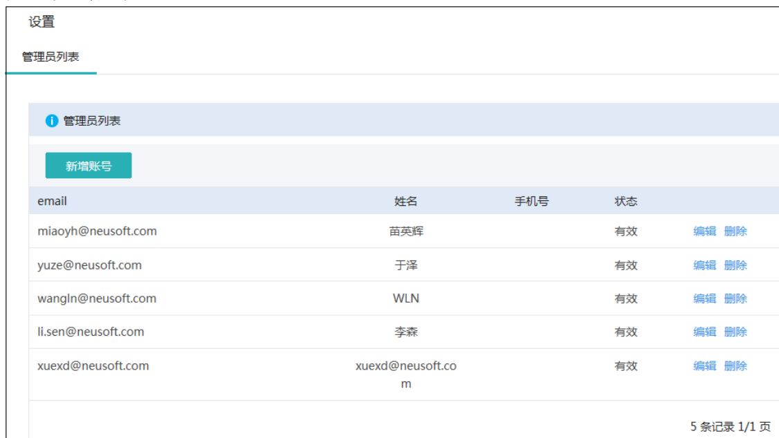
图 9 设置管理员

在设置管理员页面下部区域显示管理员列表，每一个管理员账号都对应着 编辑 和 删除 链接。点击 编辑 链接，可以修改该管理员信息，其操作方法与新增账号相同，请参考下面的叙述；点击 删除 链接，可以删除该管理员账号。