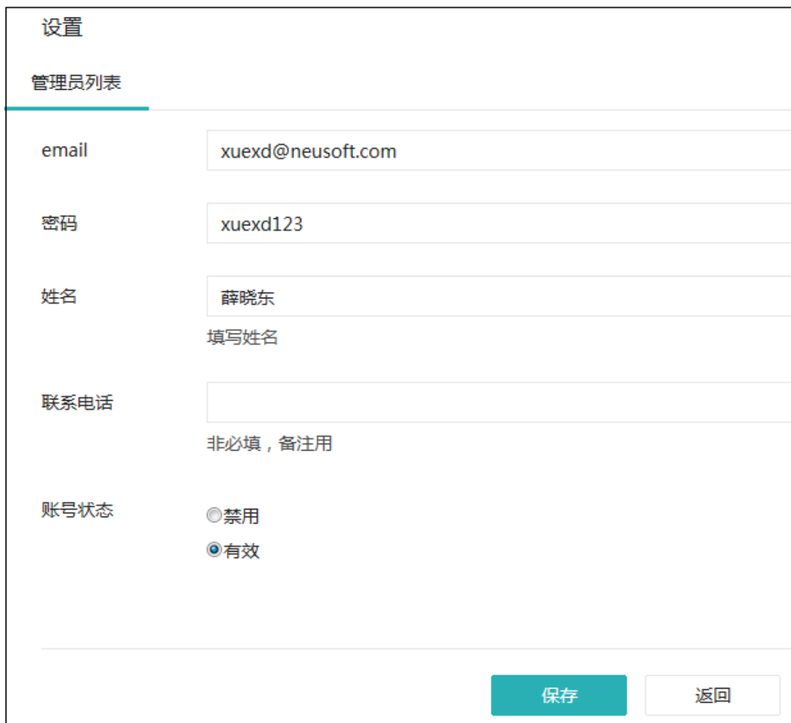
图 10 新增账号