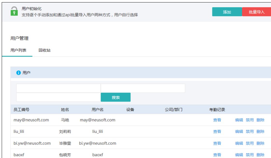
图 11 管理考勤人员