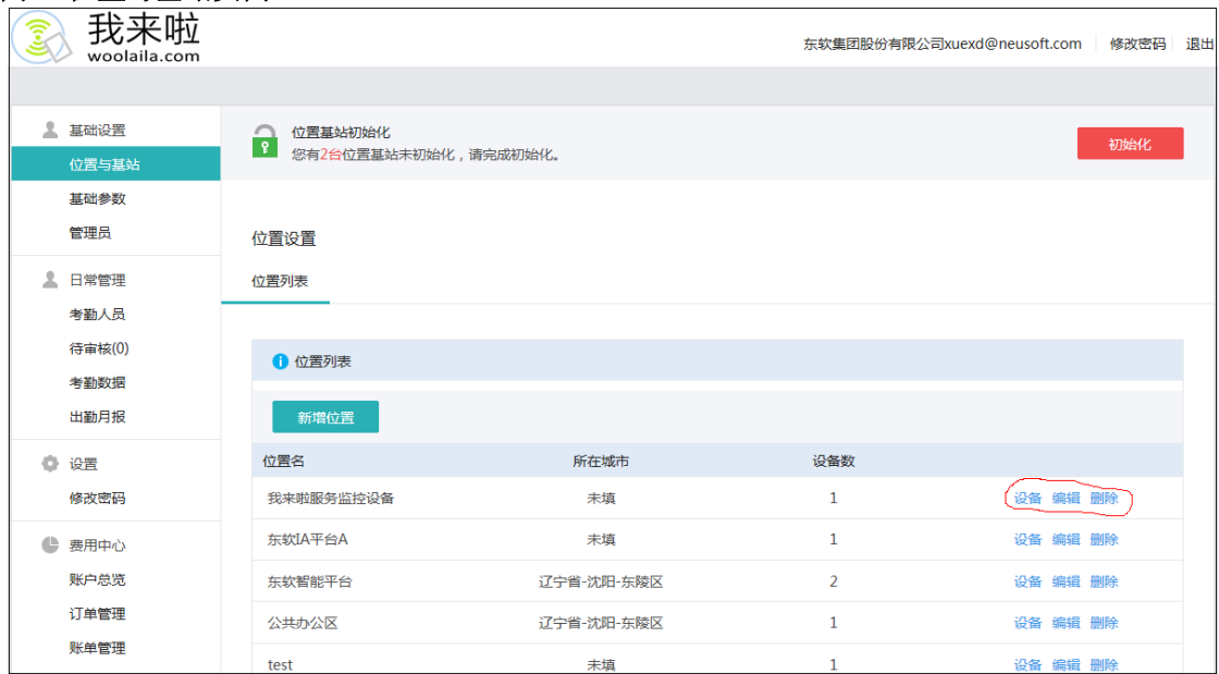
图 2 位置与基站页面